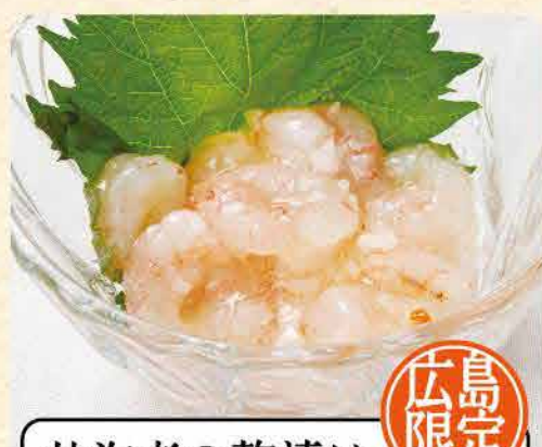
甘海老の麹漬け 455yen (税込 500yen)