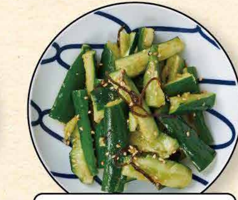
たたききゅうりの 塩昆布和え 345yen (税込 380yen)