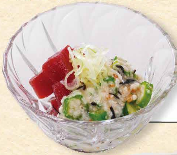
まぐろの五穀ひじき とろろかけ 618yen (税込 680yen)