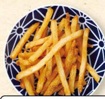
フライドポテト 409yen (税込 450yen)