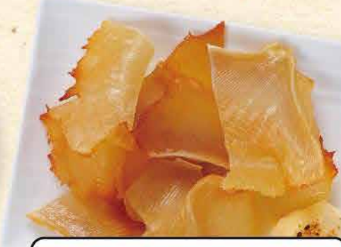
エイヒレの炙り 455yen (税込 500yen)