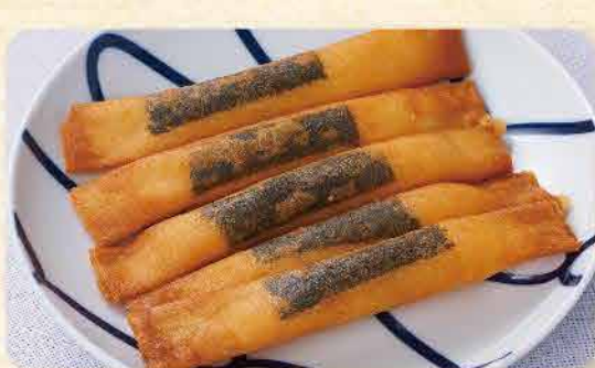
海苔チーズスティック 436yen (税込 480yen)