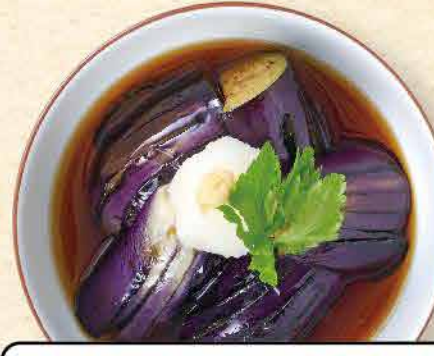
茄子の揚げ出し 409yen (税込 450yen)