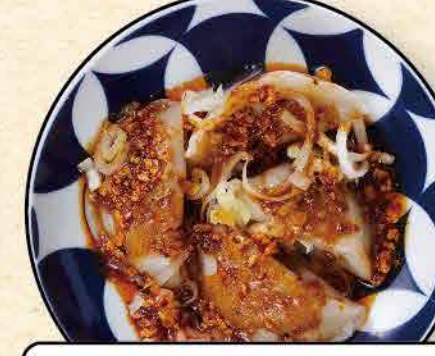
よだれ水餃子 436yen (税込 480yen)