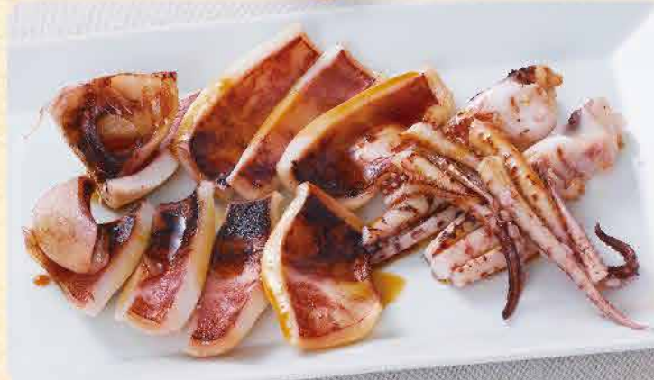
いかの一夜干し 891yen (税込 980yen)