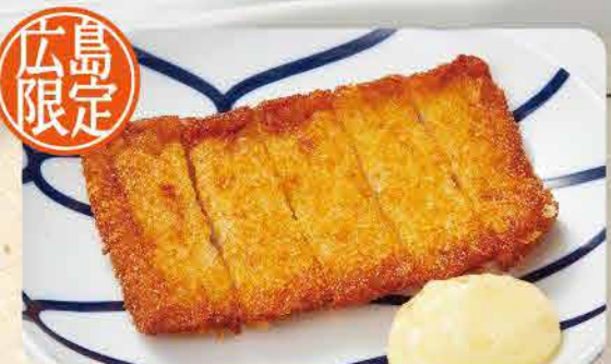
揚げがんとす 436yen (税込 480yen)