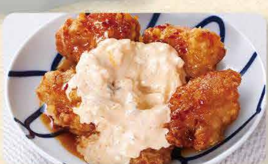
明太タルタルチキン南蛮 527yen (税込 580yen)