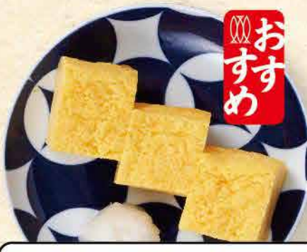
玉子焼き 409yen (税込 450yen)