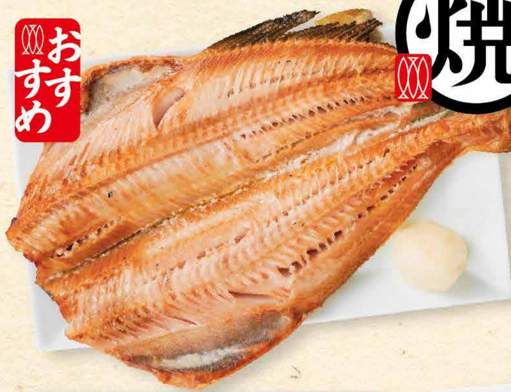
干物屋さんの ホッケ 1,164yen (税込 1,280yen)