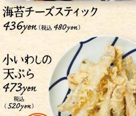
小いわしの 天ぷら 473yen (税込 520yen)