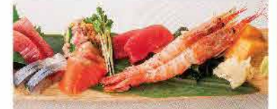
お刺身盛り合わせ (小) 1,709yen (税込 1,880yen)