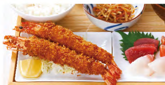
有頭海老フライと お刺身定食 1,680yen