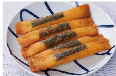
海苔チーズ スティック 480yen