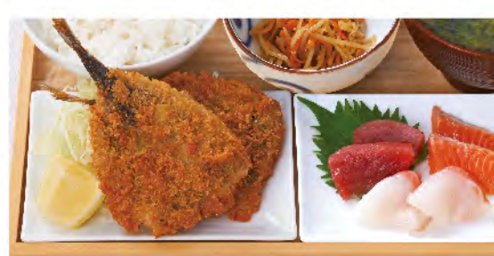
境港産アジフライと お刺身定食 1,430yen