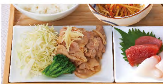
豚の生姜焼きと お刺身定食 1,430yen