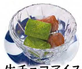
生チョコアイス ハーフ&ハーフ (チョコ味&抹茶味) 420yen