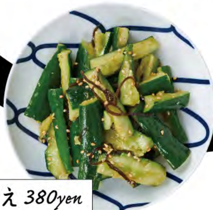
たたききゅうりの塩昆布和え 380yen