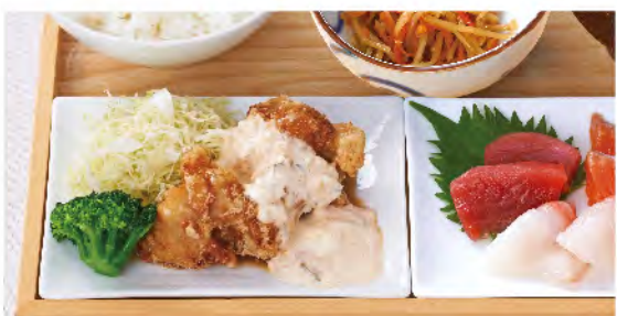
明太タルタルチキン南蛮と お刺身定食 1,380yen