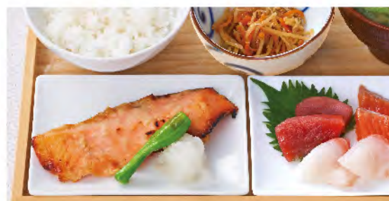
銀鮭西京焼きと お刺身定食 1,580yen