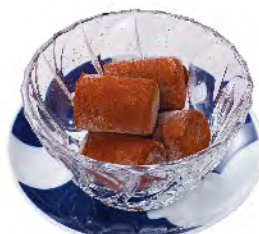
生チョコアイス チョコ味 420yen