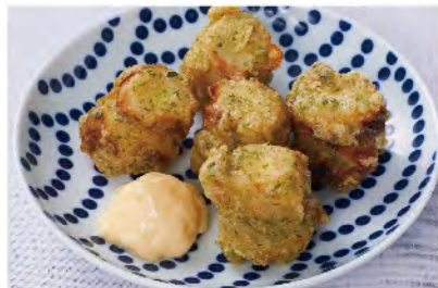
チーズちくわの 磯辺揚げ 680yen