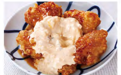
明太タルタル チキン南蛮 580yen