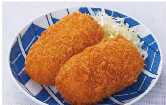
蟹クリームコロッケ 650yen