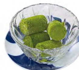
生チョコアイス 抹茶味 420yen