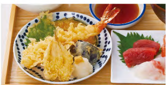
天ぷらとお刺身定食 1,580yen