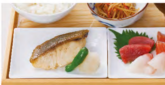
沖目鯛の備長炭干しと お刺身定食 1,780yen