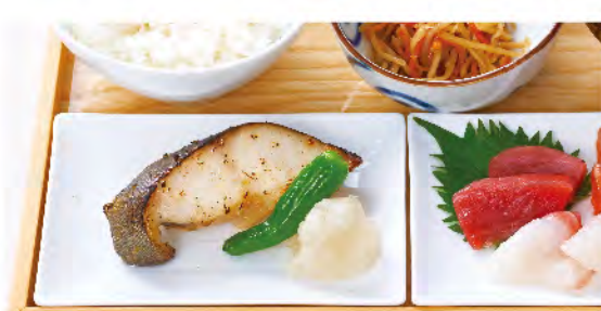
銀だらの西京焼きと お刺身定食 1,850yen