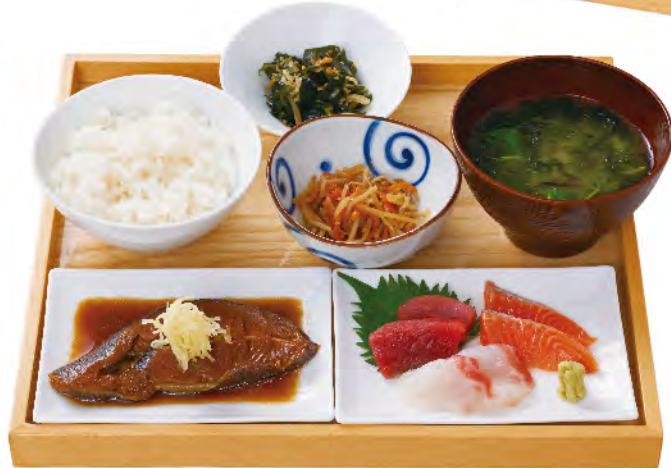
からすがれいの煮つけと お刺身定食 1,780yen