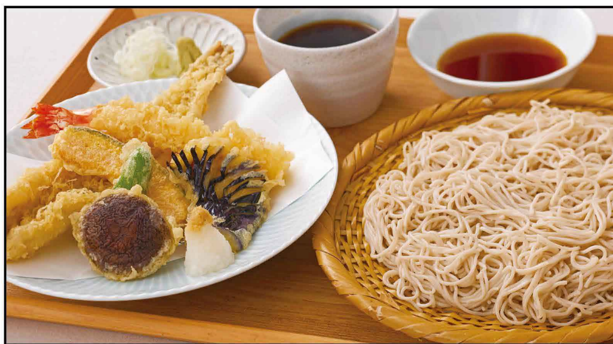
Tempura and Chilled Soba