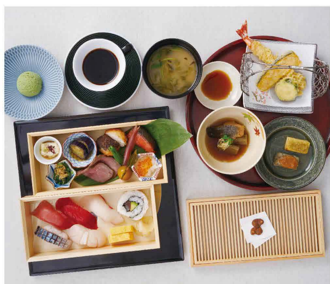
KINZA Two-Tiered Wooden Meal Box

・前菜四種 Assorted Appetizers (4 kinds) ・お造り二点 Assorted Fresh Sashimi (2 kinds) ・天婦羅盛り合わせ Assorted Tempura ・ローストビーフ Roast Beef ・銀だらの煮付け Simmered Sablefish 《一段》 First Tier Meal Box ・前菜八寸 Appetizer Sampler 《二段》 Second Tier Meal Box ・寿司六貫 Sushi 6 pieces ・生麩の田楽 Miso-glazed Nanafu Raw Wheat Gluten ・海老と 旬野菜の天婦羅 Prawn and Seasonal Vegetables Tempura