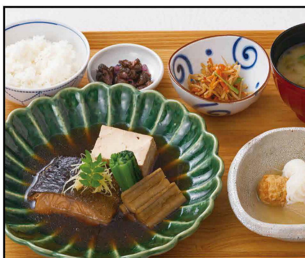
Simmered Sablefish Set Meal