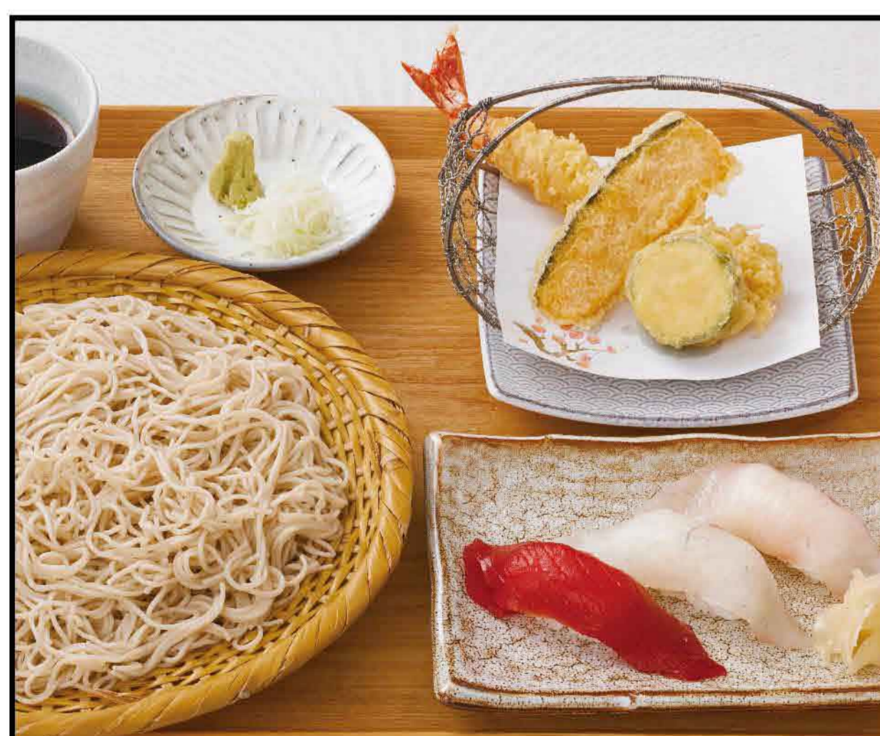
Seiro Soba Noodles, Tempura and Hand-shaped Sushi Set Meal