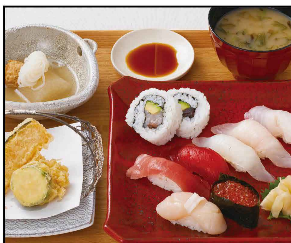
Premium Sushi Set Meal