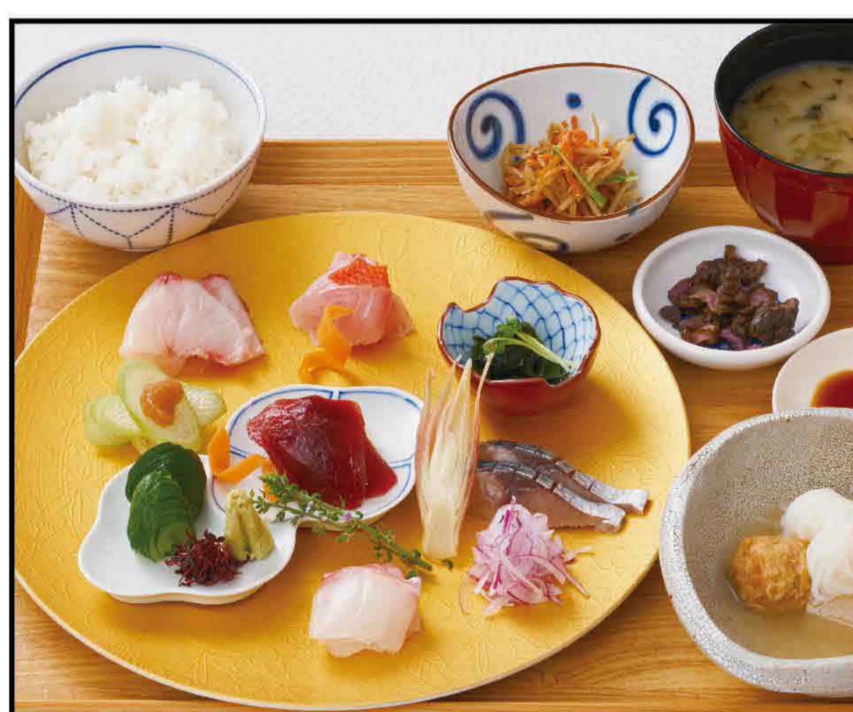
Choicest Assorted Fresh Sashimi Set Meal