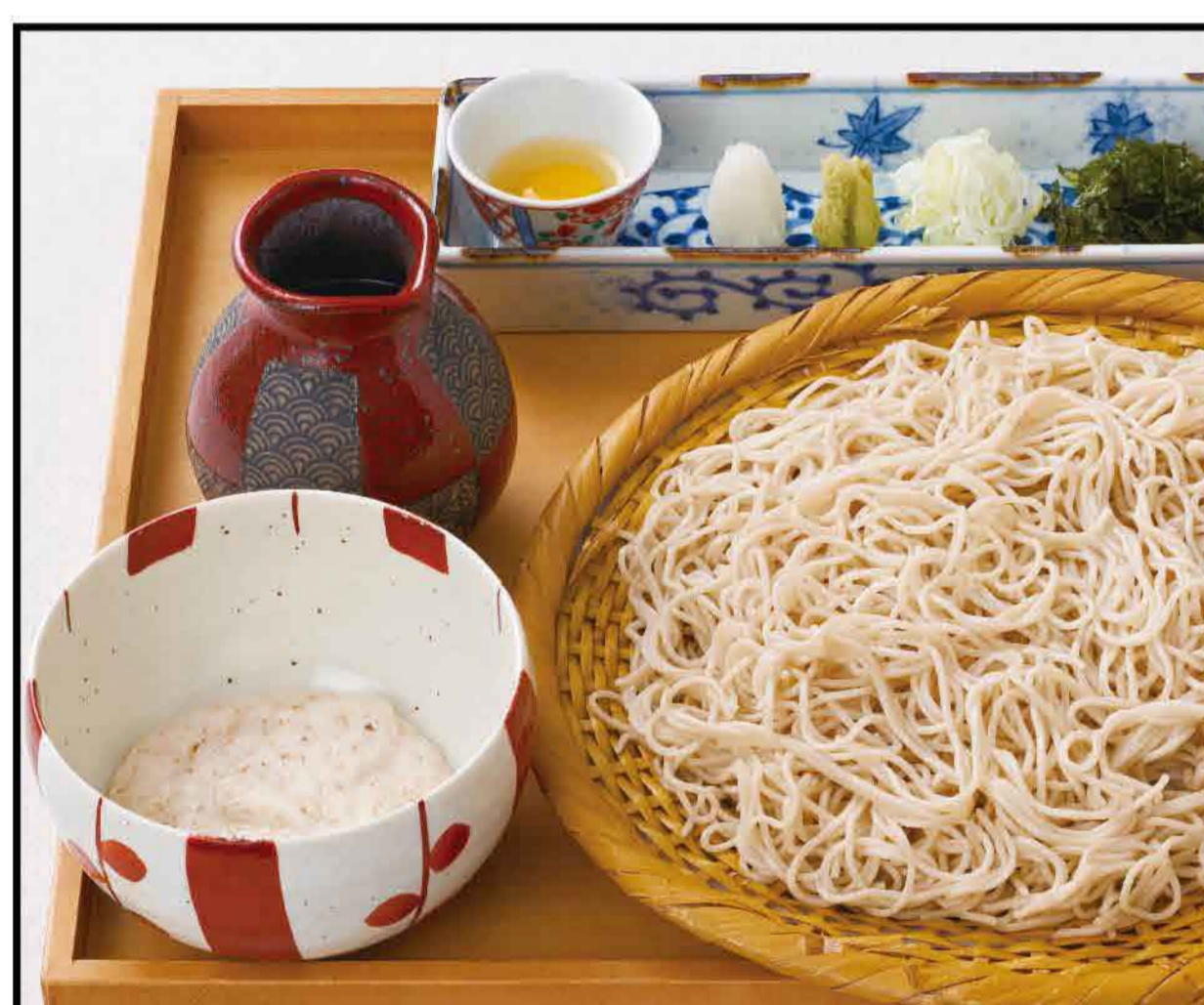
Seiro Soba Noodles with Slimy Grated Yam