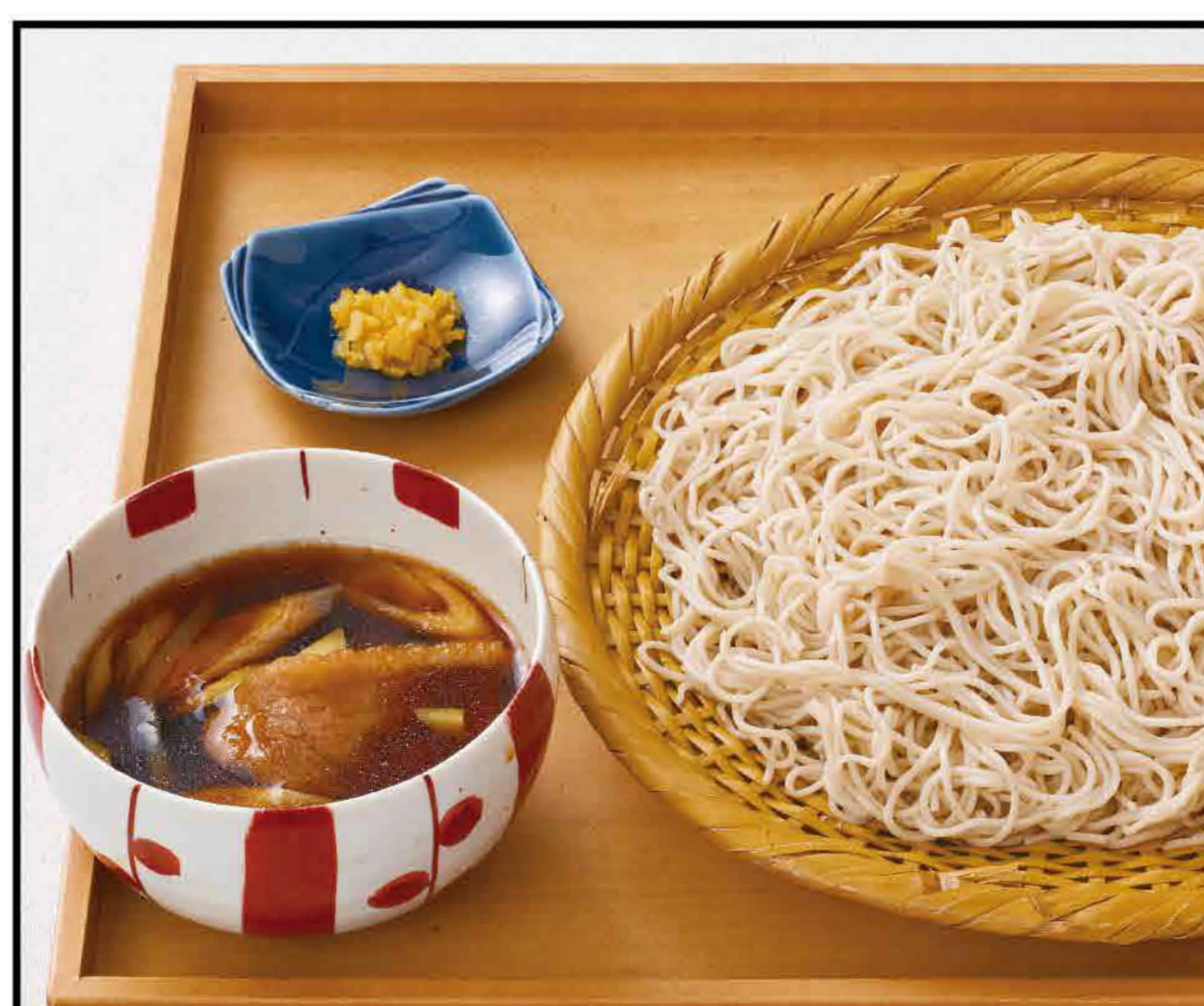
Chilled Soba with Duck in Warm Dipping Sauce