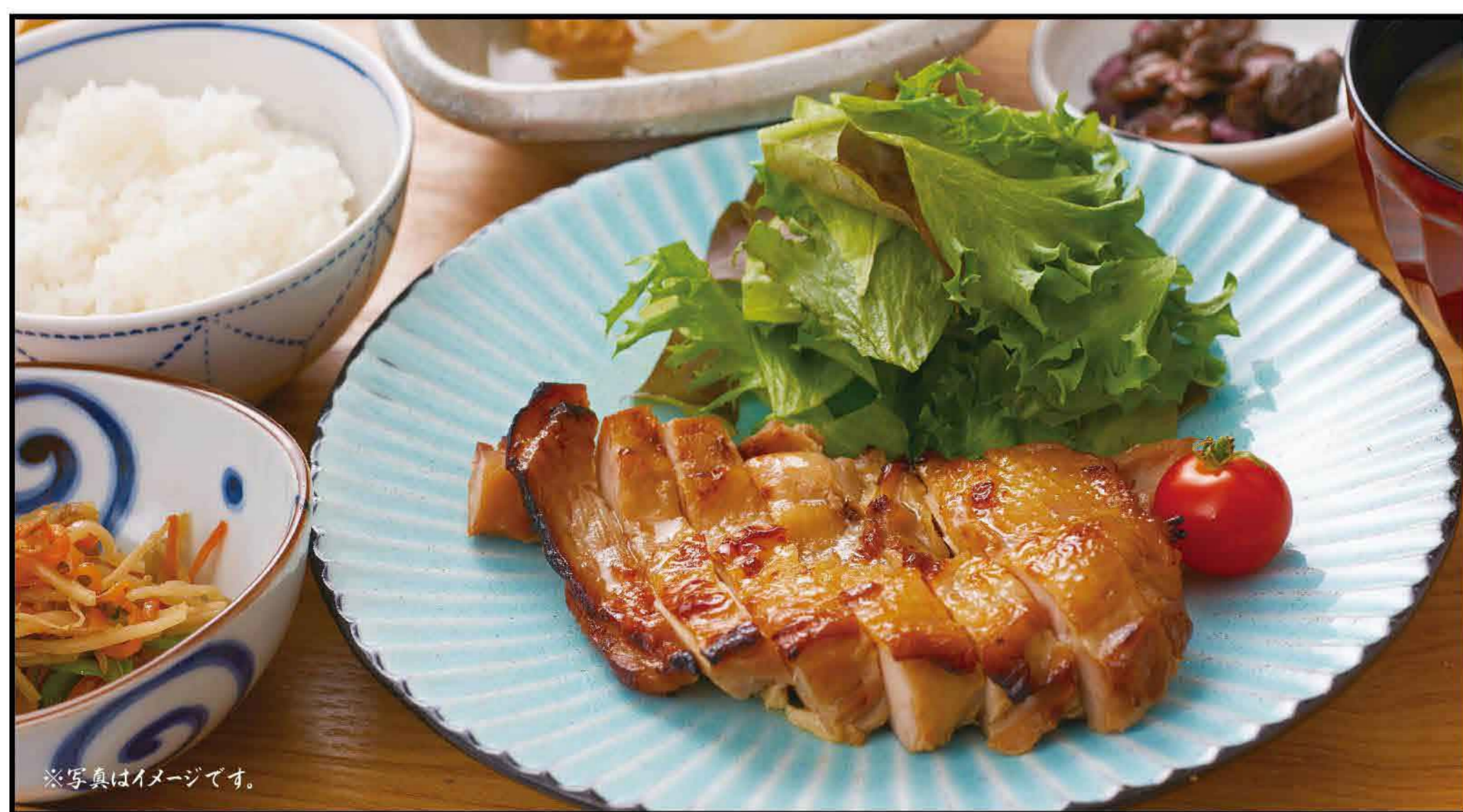
Todays Recommend Plate