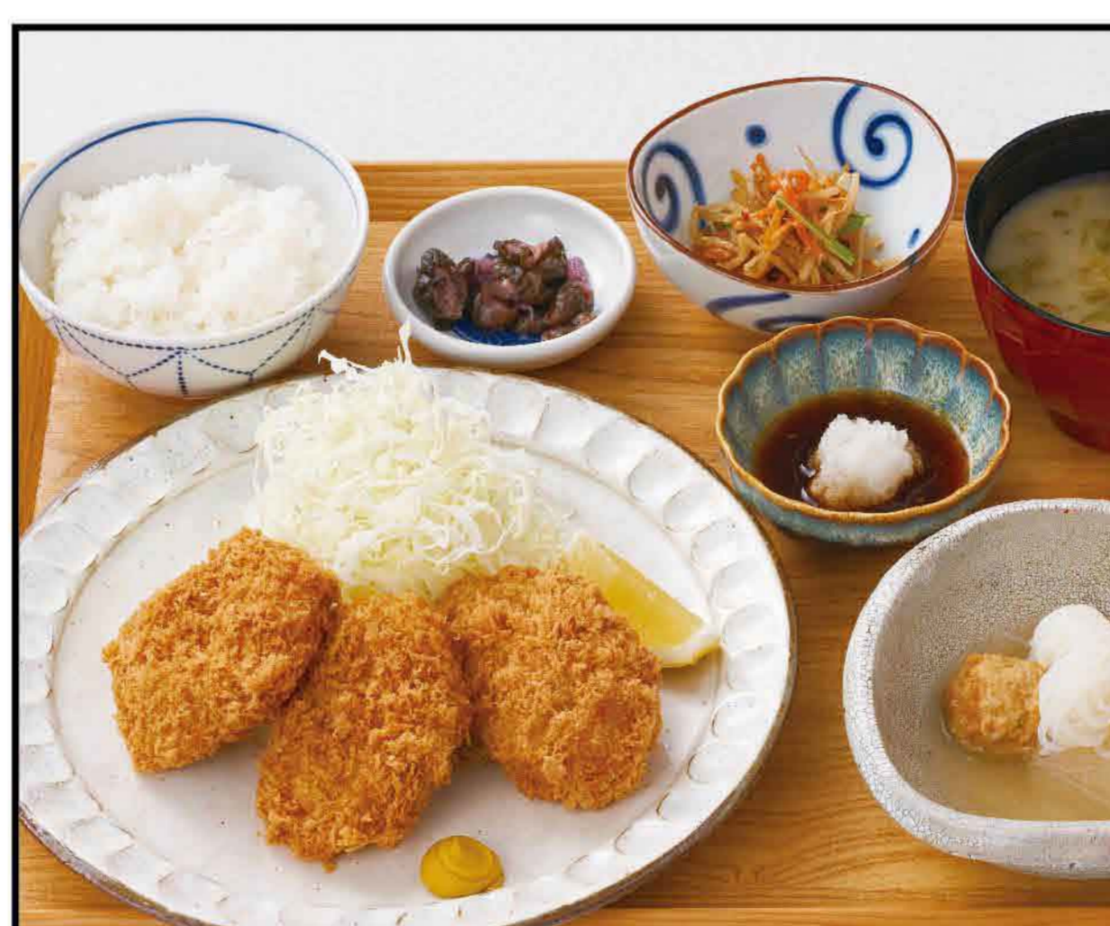
"Sangen" Pork Fillet Cutlet