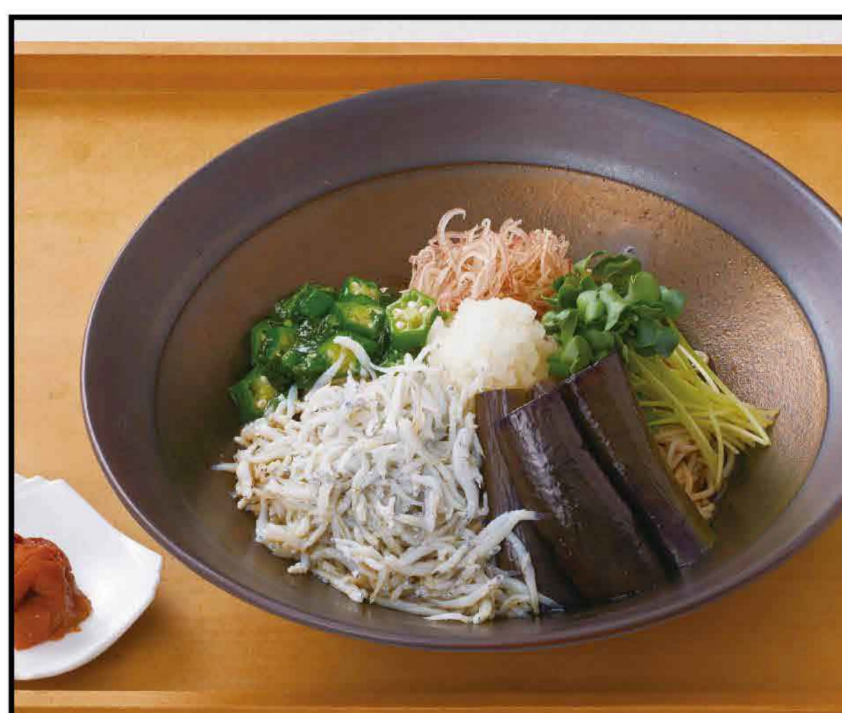
Cold Soba topped with Plum and Young Sardine