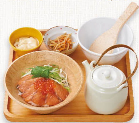
サーモンと いくらのだし茶漬 ¥1,200