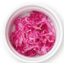
紫キャベツの和風ピクルス ¥50