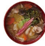
野菜を食べる 無添加豚汁