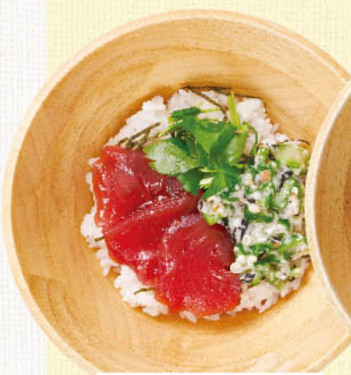
まぐろと 雑穀とろろごはん