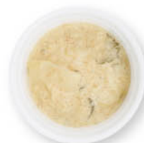
明太タルタルソース ¥30