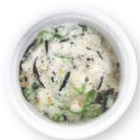
雑穀ひじきオクラとろろ ¥100