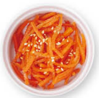
キャロットナムル ¥50