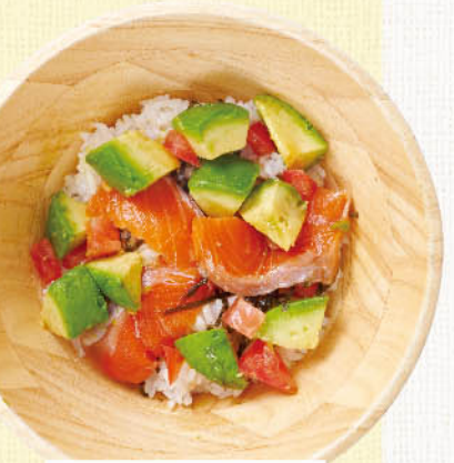
サーモン アボカドごはん