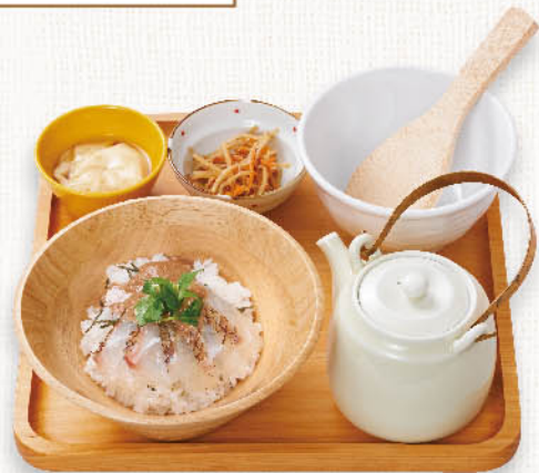
真鯛の胡麻ダレ だし茶漬 ¥1,150