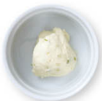
わさびクリームチーズ ¥100