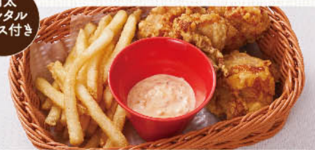
フライドポテト+鶏の唐揚げ ¥780