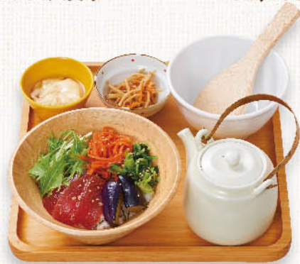
まぐろと野菜ナムルの だし茶漬け ¥1,180