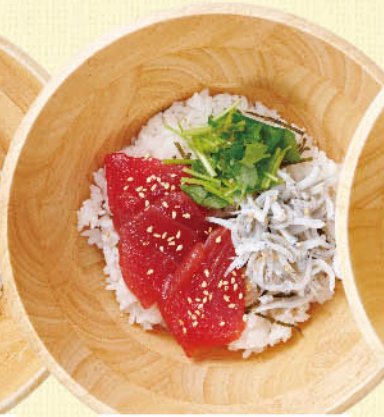
まぐろと 釜揚げしらすごはん