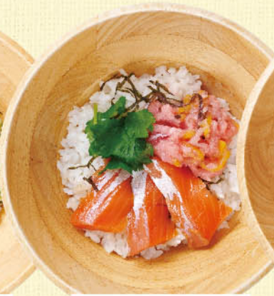
サーモン トロたくごはん