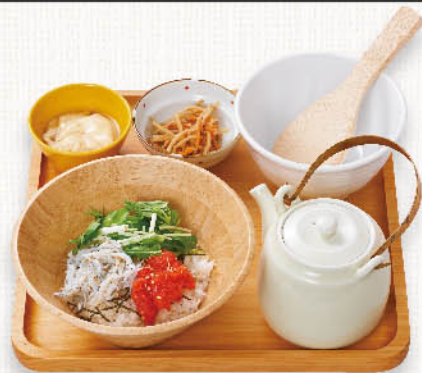
辛子明太子と釜揚げしらすの だし茶漬け ¥1,100